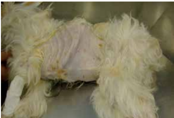
Figura 1. Condição corporal do animal relatado no pré-operatório da cirurgia de Gastrotomia.