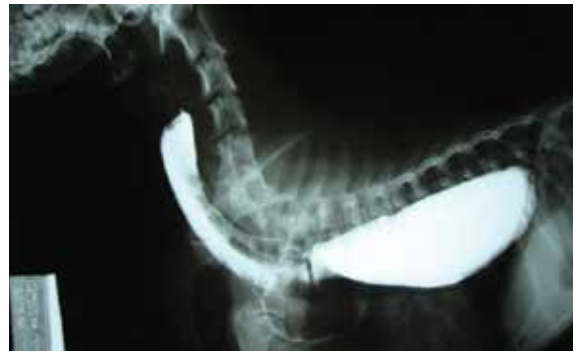
Figura 2. Radiografia contrastada confirmando presença de dilatação esofágica (megaesôfago).

Discussão: Dos exames complementares realizados, apenas a ALT apresentou um aumento significativo (272 U/l) em relação aos valores de referência para cães, caracterizando uma possível alteração hepática, consequência do estado nutricional do animal. A radiografia contrastada confirmou a suspeita clínica de megaesôfago. No entanto, durante o procedimento cirúrgico da toracotomia exploratória, confirmou-se a persistência do ducto arterioso, diagnosticando assim a causa primária do megaesôfago. Procedeu-se a correção cirúrgica da anomalia e o paciente se recuperou do procedimento, porém foi a óbito devido a uma pneumonia aspirativa, após quatro dias de pós-operatório.