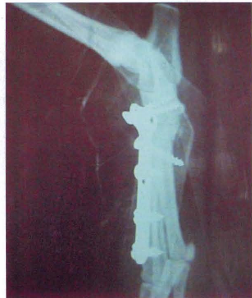
Figura 3 – Imagem radiográfica em projeção médio-lateral apresentando artrodese parcial do tarso com placa em “t”

Após o animal ter sido devidamente preparado para cirurgia asséptica, as articulações foram expostas através de incisão da pele em abordagem dorsal, os tendões flexor digital e extensor foram alternadamente afastados lateral e medialmente para que fosse possível o debridamento da cartilagem articular. A placa em “t” foi posicionada de maneira que os dois parafusos proximais ficassem fixados no tarso e os quatro parafusos distais no terceiro metatarsiano (Figura 3).