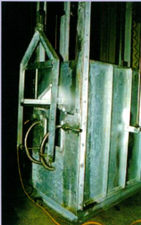
Figura 2. Modelo do boxe de contenção ASPCA.

corta, entre o primeiro e o segundo anel da traquéia, a pele, as veias jugulares, as artérias carótidas, o esôfago e a traquéia, não podendo encostar o fio da faca nas vértebras cervicais. A incisão deve ser executada sem interrupção, sem movimentos bruscos, sem perfuração, sem dilacerações e nem sobre a laringe. Após a incisão, o animal é suspenso ao trilho, seguindo para o término da sangria e esfolagem (PICCHI e AJZENTAL, 1993; PICCHI, 1996).