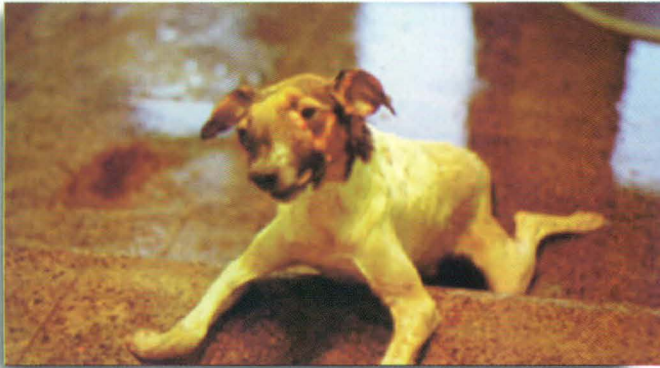
Figura 1 - Rigidez Cadavérica. Cão com tumor venéreo transmissível em seio nasal