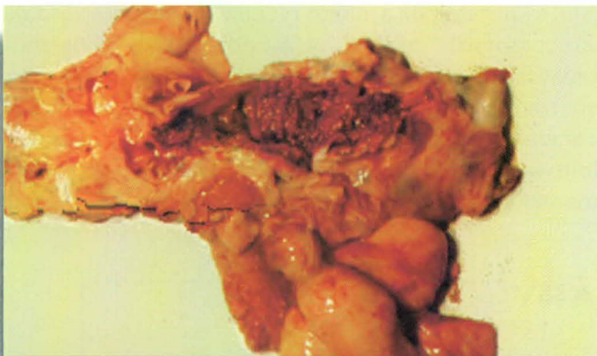
Figura 3 - Trombose. Arterite verminótica por Strongylus vulgaris em equino