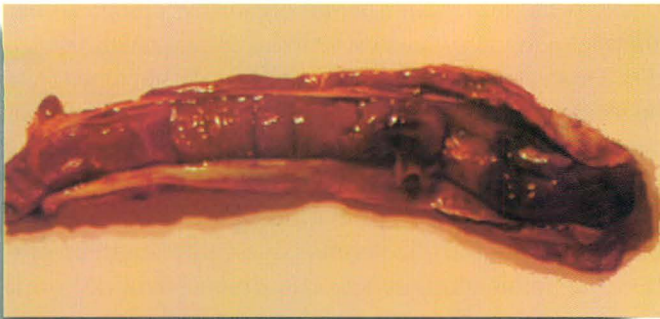
Figura 2 - Trombose. Veia jugular de equino