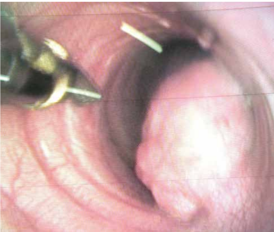
Figura 3 - Traqueobroncoscopia evidenciando massa intraluminal na traqueia.