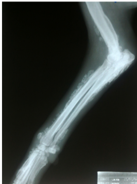
Figura 1: Radiografia do membro torácico direito de cadela com proliferação óssea

Foram realizados exames radiográficos nos membros torácicos (Figura 1), observando-se presença de reação periosteal proliferativa junto às regiões de diáfise medial e distal, além de epífise distal de úmero, bilateral e reação periosteal proliferativa junto às regiões de diáfise proximal, médio e distal, assim como nas epífises proximal e distal de rádio e ulna, bilaterais.