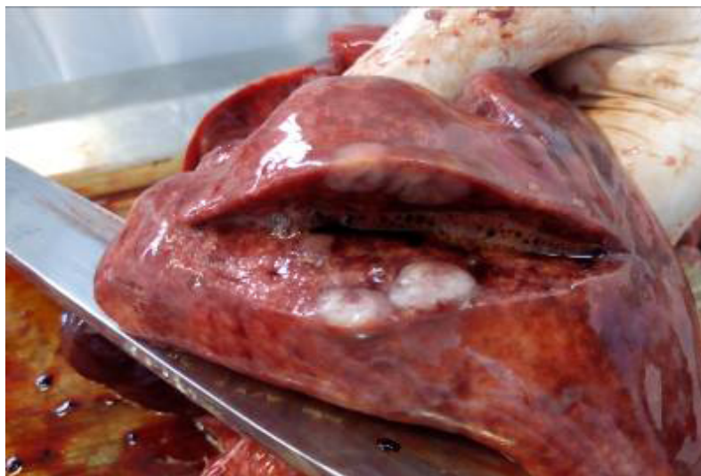
Figura 5: Nódulos metastáticos em pulmão de cadela

Com relação às vísceras internas, observou-se em todos os lobos pulmonares, diversas neoformações nodulares de coloração esbranquiçada, consistência firme e tamanhos variáveis, entre 0,8 cm x 0,9 cm a 1,7 cm x 1,5 cm (Figura 5). Além disso, os pulmões apresentaram coloração escura avermelhada multifocal, abaulamento dos lobos e presença de material espumoso ao corte caracterizando congestão moderada e edema pulmonar. No coração havia espessamento valvar condizente com endocardiose, o fígado apresentava os lobos abaulados e de coloração vermelha escura de forma difusa compatível com congestão acentuada. Também foi observada acentuada congestão em ambos os rins e congestão moderada em baço.