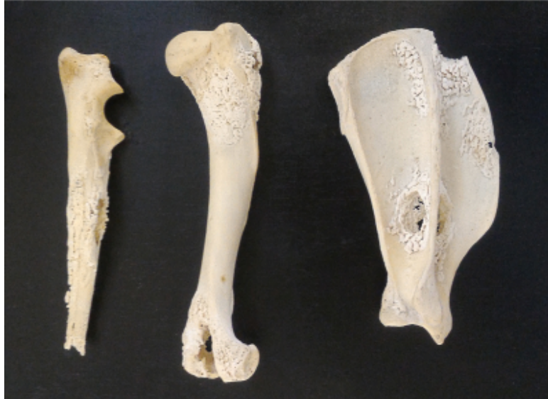
Figura 6: Ossos de cadela acometidos pela osteopatia hipertrófica. Método: maceração biológica

A forma de apresentação clínica da doença mais grave é a neuroinvasiva, com acometimento Os ossos dos membros torácicos e pélvicos direitos e esquerdos tinham aparência porosa e irregular, assemelhando-se a corais. Os ossos mais acometidos eram a escápula, úmero e rádio de ambos os membros (Figura 6).