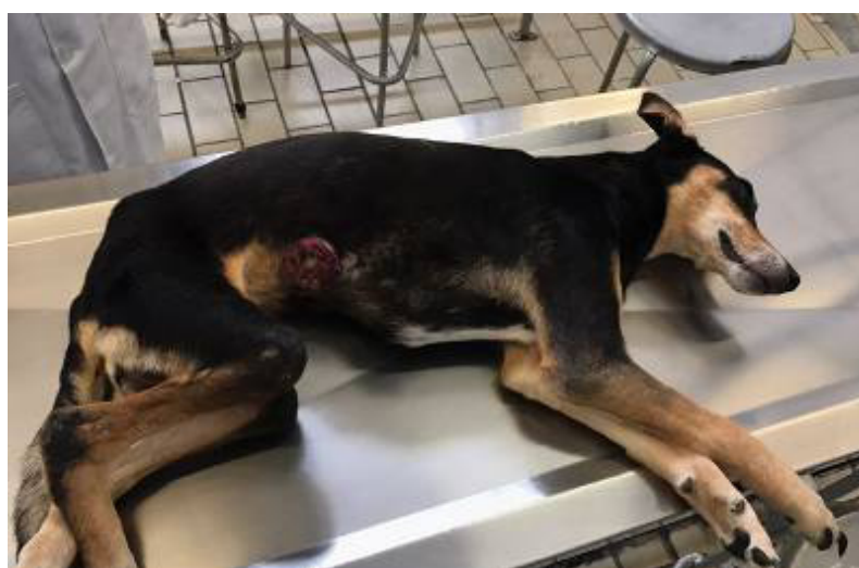
Figura 3: Cão fêmea, com aumento de volume em membros e neoplasia mamária

Ao exame necroscópico notou-se, principalmente ao exame externo, aumento de volume nos quatro membros do paciente (Figura 3) e duas neofomações mamárias (Figura 4).