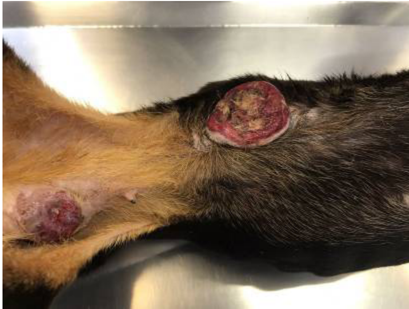
Figura 4: Cão fêmea, com neoplasias mamárias ulceradas nas glândulas mamárias abdominal cranial direita e inguinal esquerda