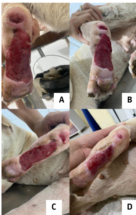
Figura 4 – Ilustração A: 28 dias; B: 35 dias; C: 42 dias; D: 49 dias de tratamento

Após a alta médica a tutora manteve retorno periódico com a paciente para acompanhamento e curativo. A Figura 4 apresenta a resposta da lesão e sua evolução com o tratamento.