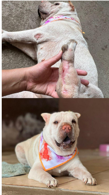
Figura 5 – Paciente apresentando boa resposta ao protocolo com 56 dias de tratamento

A paciente respondeu positivamente ao tratamento, e após 56 dias de acompanhamento, as lesões já estavam praticamente cicatrizadas por completo, proporcionando uma boa qualidade de vida ao animal (Figura 5).