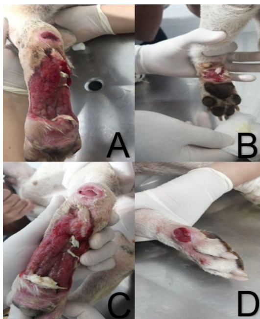
Figura 3 – Figura A e C apresentando crescimento de granulação que recobriu os tendões antes expostos, e figuras B e D demonstrando cicatrização de feridas menores