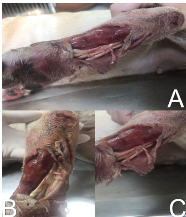
Figura 2 – Figuras A, B e C demonstrando a evolução das lesões em membros pélvicos da paciente