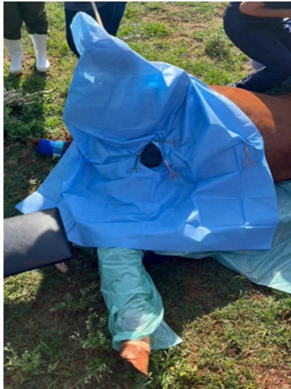
Figura 1 – Campo cirúrgico de TNT, fixado por meio de pinças Backhaus, durante a castração de equino a campo. Um recorte circular permite a exteriorização da região escrotal.