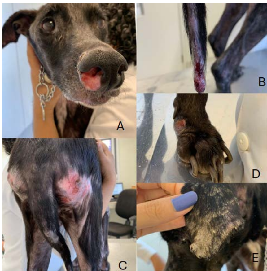
Figura 1 – Manifestações clínicas cutâneas da leishmaniose visceral canina 1